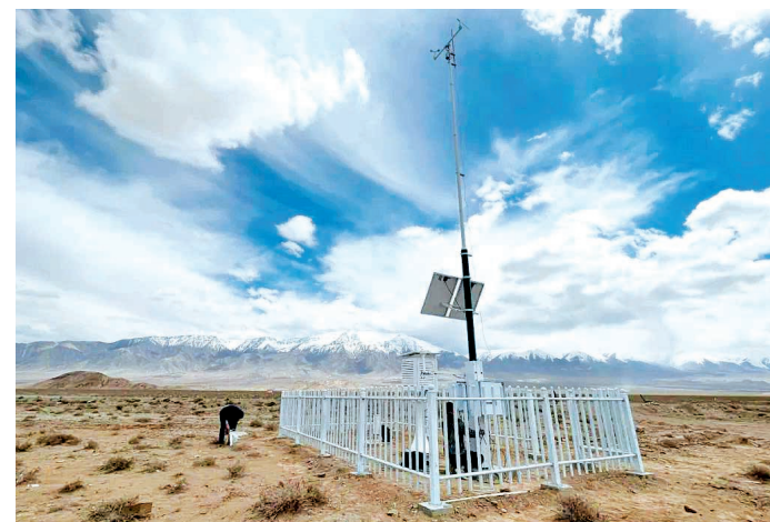
近日，若羌县气象局技术人员在阿尔金山安装气象站设施。

本报若羌7月9日讯（通讯员 刘志秀 鄢卉平）为进一步扩大山区气象监测站点覆盖范围，提高山区气象预报的准确性，保障矿区企业安全生产，近日，若羌县气象局在阿尔金山增设5个自动气象站。