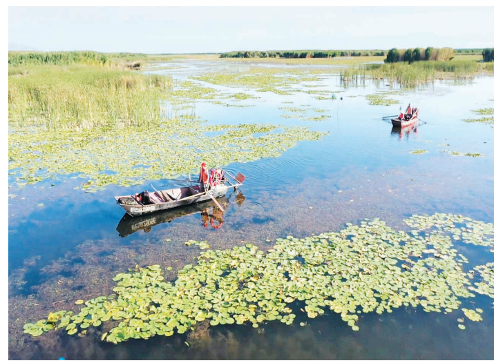
7月8日，博湖县蟹农划着渔船前往博斯腾湖西南小湖区收螃蟹。

近年来，博湖县通过源头治理、清污分离、截污分流、截污增淡、促进水体循环、水体交换等一系列措施，使博斯腾湖生态环境得到持续改善。目前，博斯腾湖内有草鱼、鲢鱼、鳙鱼、鲤鱼、池沼公鱼等32种鱼类及青虾、中华绒螯蟹、河蚌等多种水产品，年产量约4000吨。