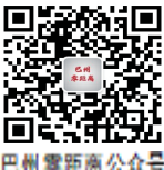
巴州零距离公众号