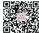
巴州零距离公众号