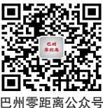
巴州零距离公众号