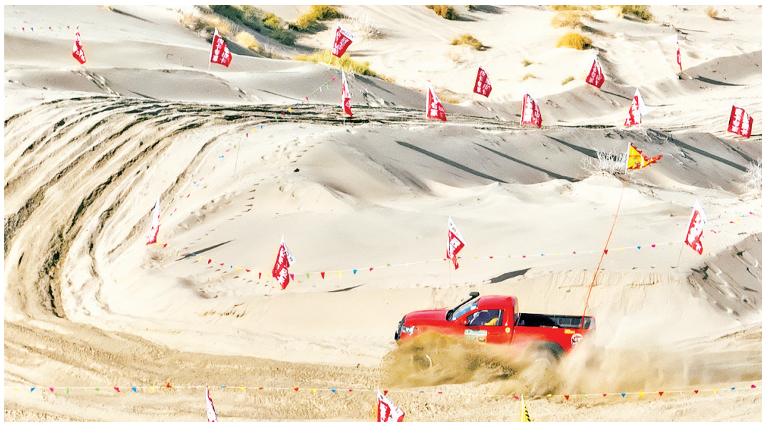
参赛选手在沙漠越野赛道上驾车驰骋。

赛事总指挥谭江峰介绍,本届赛事的亮点,是创新采用“拉力赛+场地赛”双轨赛制。拉力赛段,赛车驰骋于环博斯腾湖公路与沙漠腹地之间,车手在挑战极限的同时,可饱览博斯腾湖烟波浩渺的壮美景观;场地赛则采用扣人心弦的两两对决模式,赛道匠心融入艾勒逊乌拉沙漠特有的蜂窝状、鱼鳞状沙丘,设置连续急弯、200米复合沙山链、险峻刀锋沙脊等高难关卡。