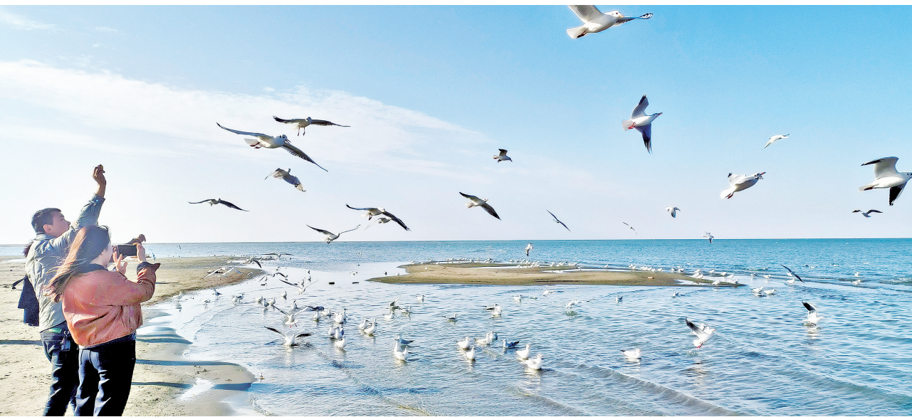
游客在博斯腾湖边与水鸟互动，构成一幅美丽的生态画卷。