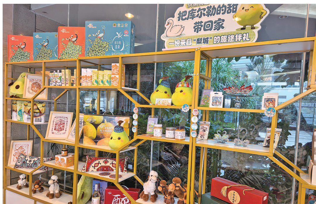
库尔勒市园林宾馆特色农产品及文创产品展销点。

这场由库尔勒市供销社联合建设街道、上恰其社区及鑫华市场打造的新春集市“有温度、有滋味、有实惠”，圈粉无数。集市上，农产品、日用百货、春节装饰品等琳琅满目，而“零中间环节”的产销对接模式，让和什力克乡、兰干乡等四个乡镇的农户直接进场销售，既减少了流通成本，又让市民享受到源头直供的实惠。“前店后仓”的设置更是保