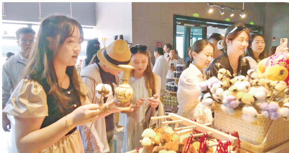
游客在挑选文创好物。

据介绍,此次上新的“尉犁礼物”文创产品,深度挖掘本地丝路历史、非遗技艺与民俗风情,整合本土优质文化资源,涵盖非遗手作、特色伴手礼、生活文创、文旅纪念四大品类。产品设计以罗布人村寨、塔里木河、千年胡杨、艾德莱斯纹样、帕拉孜编织等标志性本土元素为灵感,匠心打造文创丝巾、特色徽章、纪念明信片、罗布麻纤维