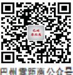
巴州零距离公众号