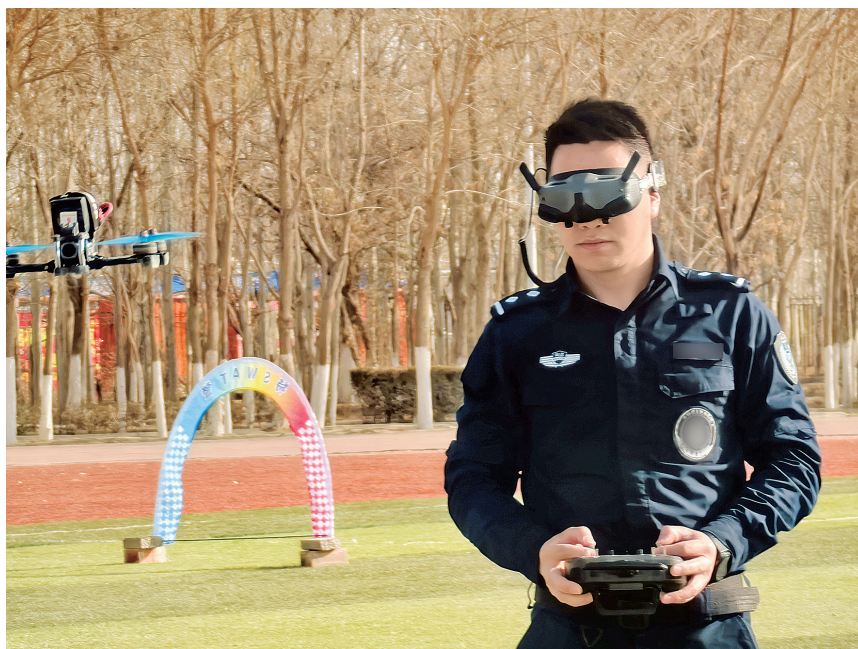
特警队员在进行穿越机精准降落训练。

障碍穿越实战攻坚环节，将此次训练推向高潮。绕桩、穿环、过窄门、钻障碍……队员们佩戴FPV视角眼镜，操控穿越机在狭小空间内高速穿行。这不仅考验反应速度，更淬炼心理素质和操控精度。训练坚持“以战促练、边练边