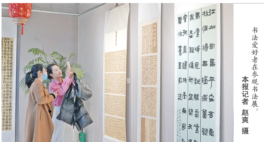
书法爱好者在参观书法展。

本报库尔勒3月19日讯（记者 赵爽）18日，巴州美术馆内墨香四溢、雅韵悠长，以“翰墨润书香 雅韵满校园”为主题的巴州二中师生书法开展展，集中展出该校师生原创书法作品90余幅，以笔墨传情、以书法载道，全面展现校园艺术教育的丰硕成果，吸引了众多书法爱好者、师生及市民前来观展。