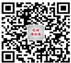
巴州零距离公众号